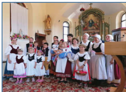
Z poutní mše svaté v Lezníku 15.8.2021 Slavnost Nanebevzetí Panny Marie